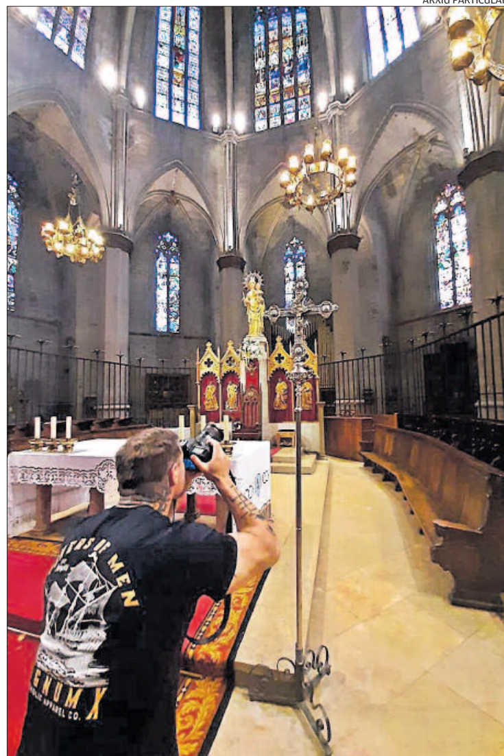
L'equip va enregistrar dilluns imatges de la Seu i de la Cova