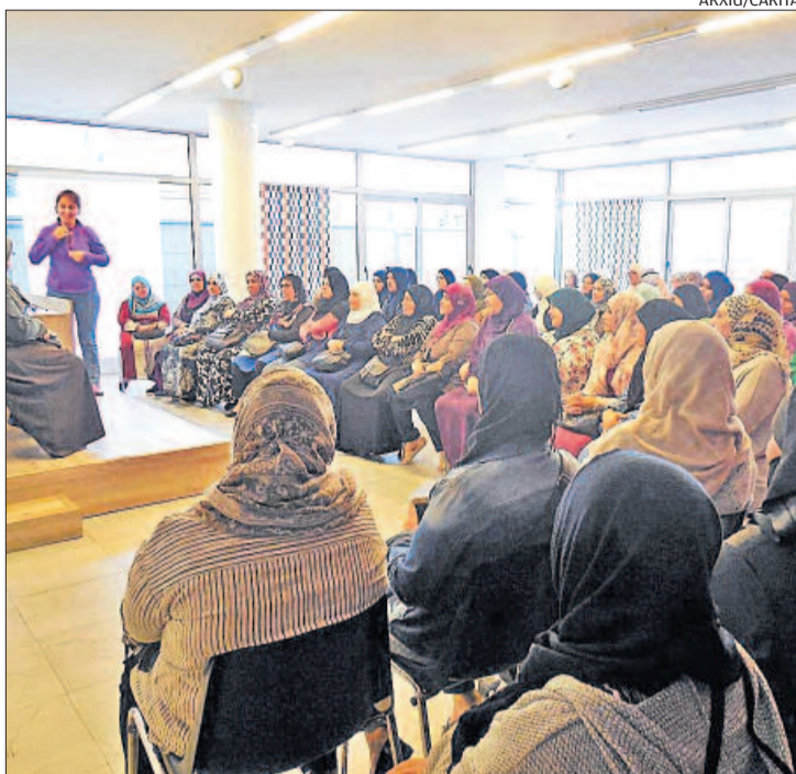
Curs d'alfabetització impartit per Càritas

L'altre motiu és l'esmentat increment de la immigració. «Nosaltres estem molt centrats en les persones nouvingudes i hi ha hagut un increment molt gran de les que han vingut a l'entitat per primera vegada. És un factor molt impor-