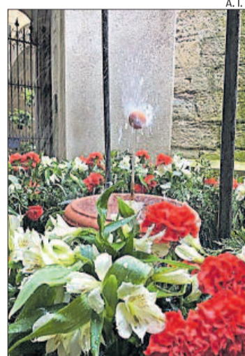
L'ou com balla al claustre, el 2018

L'any passat es va recuperar la tradició del l'ou com balla, que feia més de 35 anys que s'havia suprimit. Un grup de manresans vinculats a l'associacionisme van proposar-ne la recuperació i, amb el suport de la basílica, van instal·lar una font al claustre neogòtic de la Seu. La iniciativa va ser molt ben rebuda pels visitants.