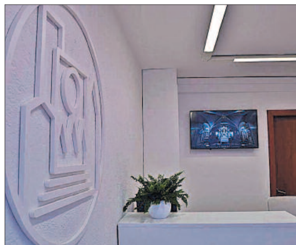
El nou punt d'acollida del temple manresà