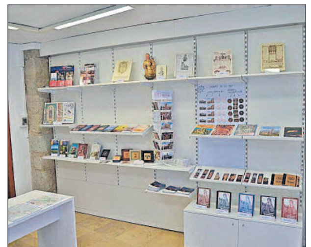
L'expositor amb el marxandatge de la basílica