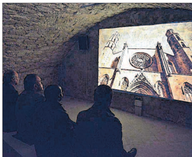
Projecció de l'audiovisual damunt la paret

Va recordar que en la promoció de la Seu encara hi ha molta feina a fer. Com a exemple, va posar que en el comitè científic d'experts de la Generalitat que van seleccionar les Ciutats amb Caràcter i Viles amb Encant -distintius que es van lliurar recentment a la Sala Gòtica de la Seu- hi havia qui va reconèixer que era la primera vegada que visitava el temple gòtic.