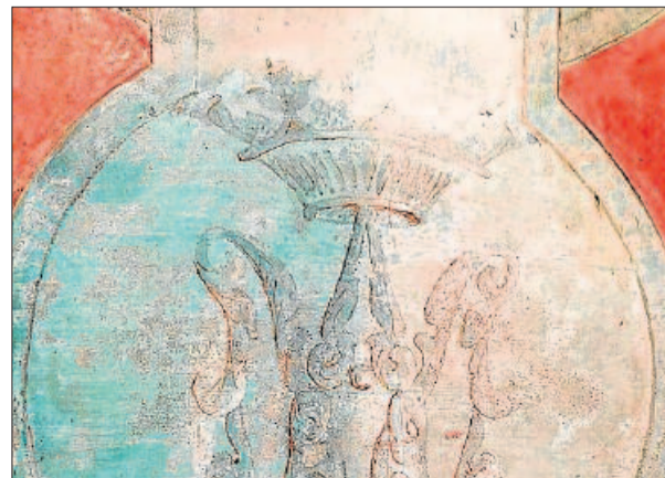
Detall d'un element decoratiu de la paret molt deteriorat