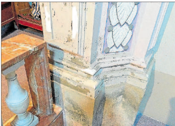
Una columna amb la pintura descrostada