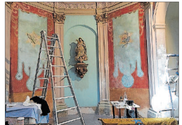
Treballs a l'interior de la capella durant les obres