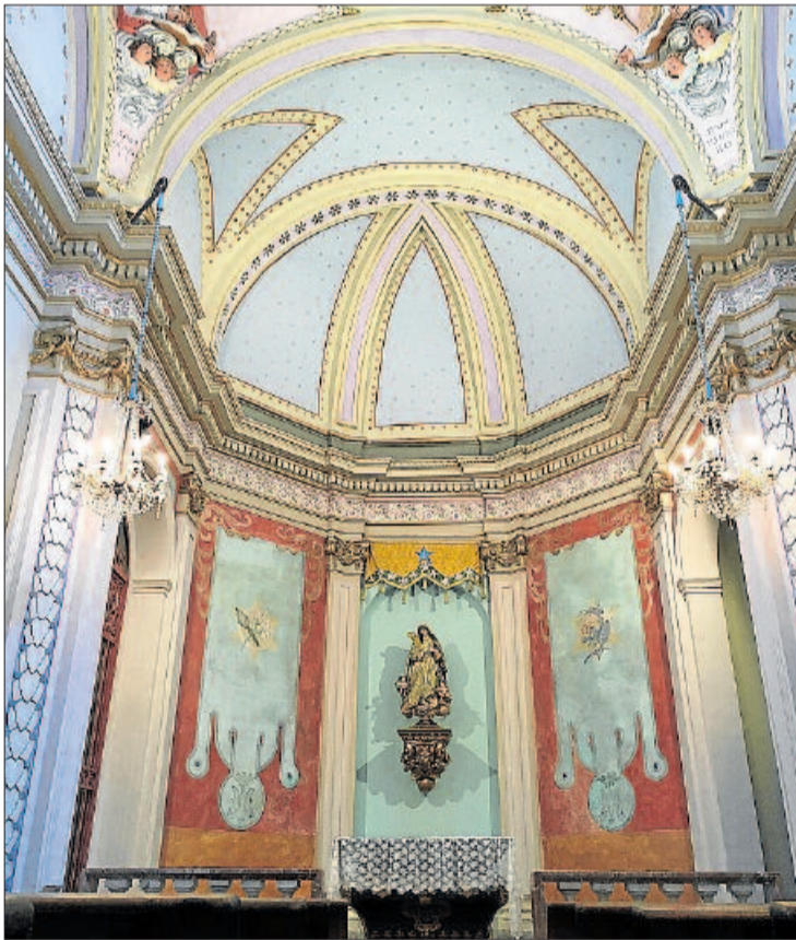
Aspecte de la capella una vegada feta la restauració