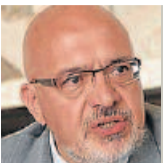
AMB LES GARROFES