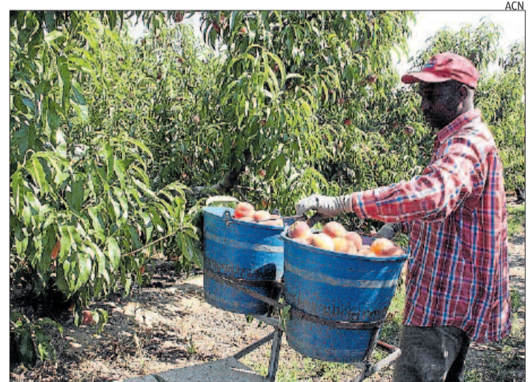
Un agricultor recull els primers préssecs en una finca d'Aitona

n JARC, a través de l'organització agrària estatal de COAG de la qual forma part, presentarà observacions al projecte d'Ordre del ministeri d'Agricultura que estableix les bases reguladores i la convocatòria de subvencions destinades a l'obtenció d'aval de SAECA (Societat Anònima Estatal de Caució Agrària) per als titulars d'explotacions de fruita dolça, que els garanteixin préstecs per finançar-se. Tot i que aquesta línia de suport era una reclamació que feien JARC i COAG, ambdues organitzacions agràries presenten al·legacions a l'esborrany d'Ordre ministerial perquè «no preveu finançar la comissió d'estudi de l'aval SAECA als titulars de les explotacions agràries prioritàries (EAP) ni als agricultors profes-