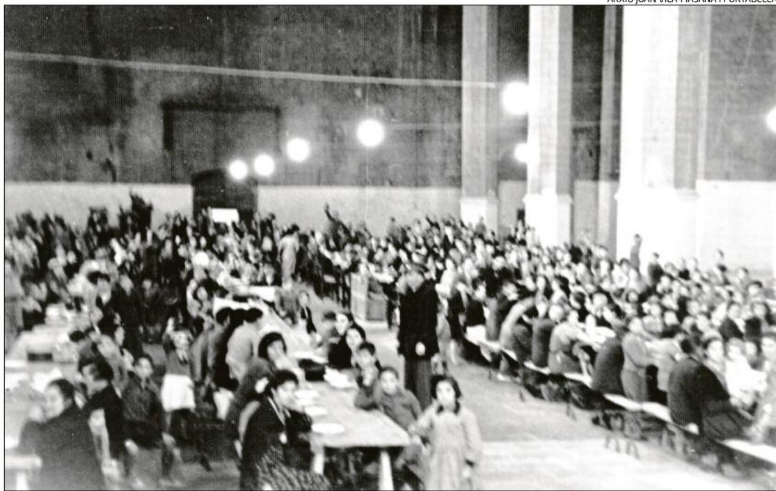
Refugiats a l'interior de la Seu asseguts a l'entorn d'unes llargues taules, entre el 1937 i el 1938

► La Seu va estar a punt de ser enderrocada a partir del setembre del 1936, tal com ho van ser unes altres set esglésies manresanes. En el web «El salvament de la Seu de Manresa, l'any 1936» s'explica amb detall com la basílica es va poder salvar. Per evitar-ne la demolició van caldre innumerable gestions de tot tipus. Les garanties que el monument no seria destruït van arribar definitivament quan el recinte fou utilitzat per a finalitats relacionades amb la guerra. Si bé a principi d'agost del 1937 el Consell Municipal acordava «habilitar l'edifici de l'ex-església de la Seu d'aquesta ciutat com a lloc d'allotjament de les tropes que puguin venir a aquesta ciutat, confeccionant-se ja en l'actualitat mil llits amb tots els atuellis corresponents, i a més s'instal·laran dutxes, rentadors, i totes les millores de caràcter higiènic que calguin», en realitat, a partir de l'octubre del 1937 serví per allotjar-hi els refugiats de guerra que anaven arribant a Manresa procedents de diferents punts de l'estat espanyol que havien estat ocupats per les tropes franquistes.