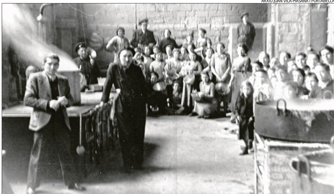
Les cuines que es van habilitar per preparar els àpats. Manresa va acollir més de 3.000 refugiats