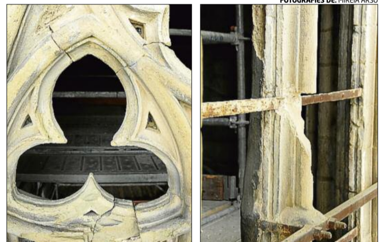
Dos detalls del mal estat en què estaven la traseria i els mainells