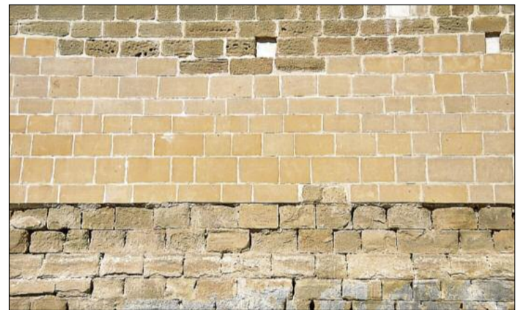
Mur on es poden veure les fileres noves i el que ha quedat pendent