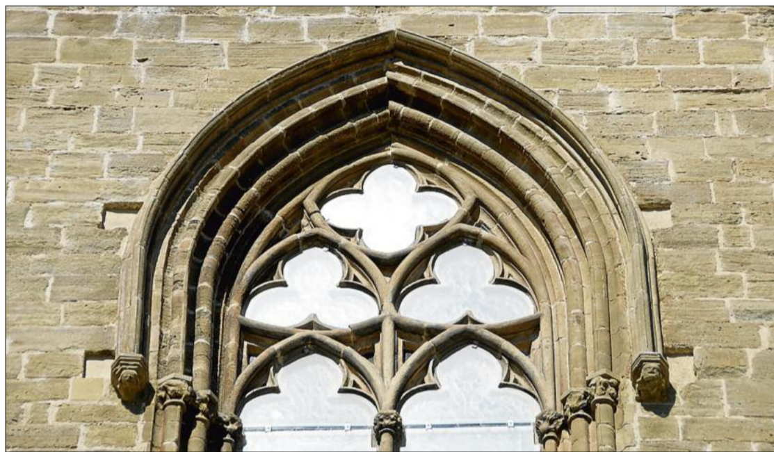
Detall de la part superior del finestral de la capella de la Puríssima. Ha passat d'estar desfeta a fer goig

► Ha calgut reajustar l'actuació per no gastar més dels 240.000 euros corresponents a una de les tres anualitats del conveni