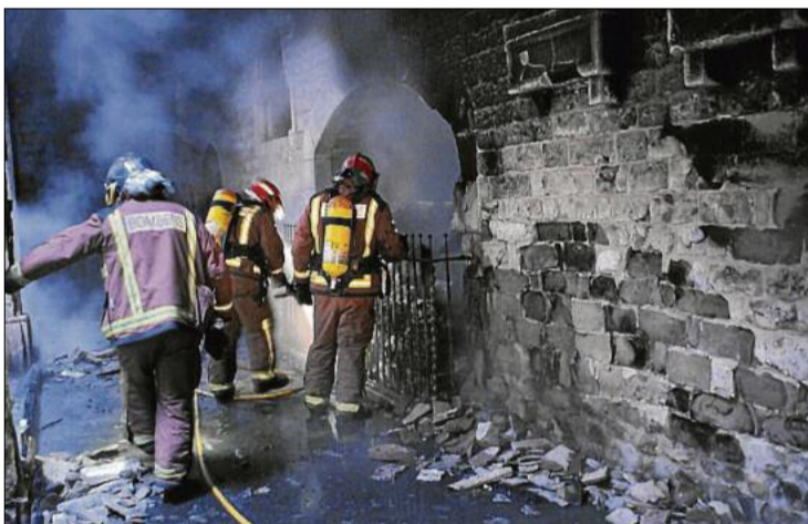
Els bombers en un moment de l'extinció de l'incendi