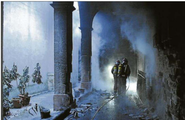
Vista general del lateral del claustre de la Seu afectat pel foc

A la tarda pel temple encara no hi havia passat el perit del bisbat de Vic, responsable de la basílica de la Seu. De fet, del bisbat, a qui Boqueras havia enviat fotos al matí per assabentar-los de la desgràcia, tampoc no s'hi va desplaçar ningú (a 2/4 de 2 del migdia el vicari general ignorava què havia passat; vegeu pàgina 3). En canvi, sí que