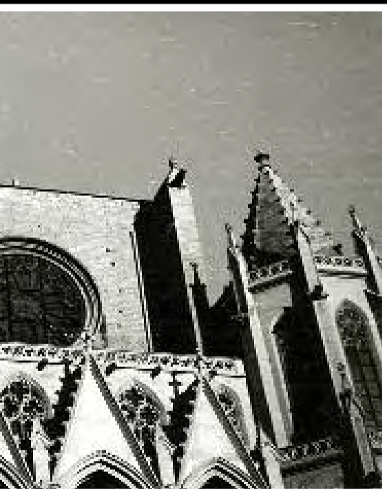
La basilica de la Seu, el 1936 en quatre impactants imatges de Josep M. Rosal, que va contribuir al salvament del patrimoni artístic del temple. No es va tenir la seguretat que la Seu no aniria a terra fins al 1937, quan el recinte va ser utilitzat per a finalitats relacionades amb la guerra.