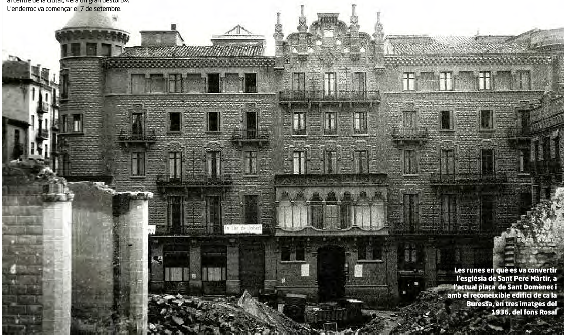
Les runes en què es va convertir l'església de Sant Pere Màrtir, a l'actual plaça de Sant Domènec i amb el reconeixible edifici de ca la Buresa, en tres imatges del 1936, del fons Rosal