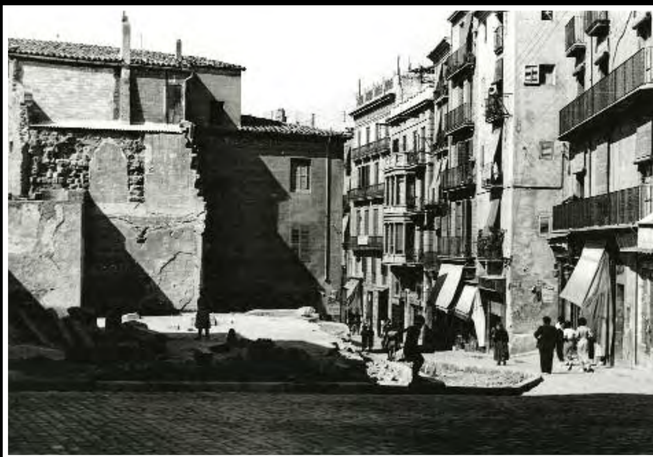
Imatges de Josep M. Rosal de l'enderroc de l'església de Sant Miquel, entre el setembre i l'octubre del 1936. Damunt d'aquestes línies, el solar que hi va quedar