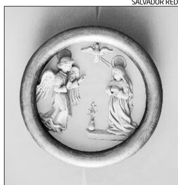
Una de les tres claus de volta