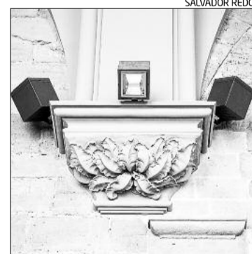
Un capitell amb motius vegetals