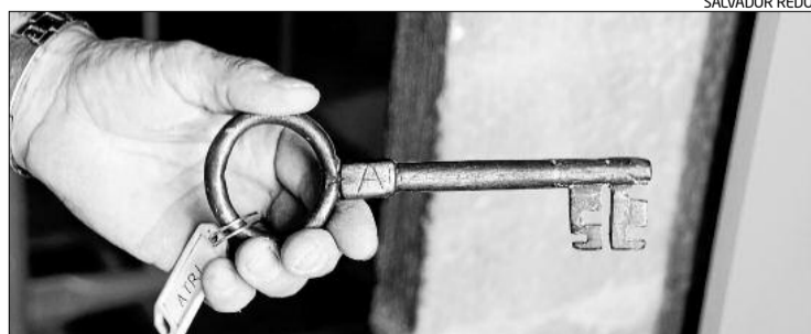
La clau de la porta de l'atri, que fins ara no es podia obrir sencera