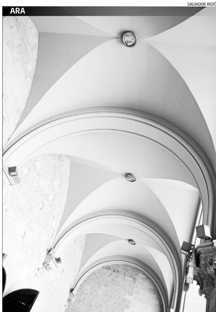
El nou sostre, amb les voltes i claus de volta imitant les de l'interior