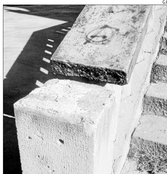
La part de la barana d'on van arrencar una llosa

temple i van robar eines de l'empresa responsable, Cots i Claret. Al mateix temps, van arrencar una llosa de l'escalinata d'accés a l'atri per la banda del riu (la de baix de tot de la barana) i van tirar un objecte contundent al vitrall corresponent a l'altar de la Mare de Déu de Lourdes (el tercer a partir del baptisteri en direcció al portal de Sant Antoni), que va trencar un dels vidres de protecció. A hores d'ara, aquests desperfectes encara no s'han pogut reparar.