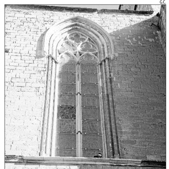
El vitrall amb el vidre de protecció que hi falta