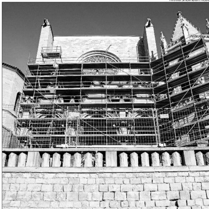
La façana de la Reforma de la Seu amb la bastida muntada, que impedeix veure els resultats de les obres que hi han fet fins ara

El conveni quadriennal actual, signat per la Generalitat, l'Ajuntament, la Diputació de Barcelona i el Bisbat de Vic, cobreix el període que va del 2009 al 2012, i va trigar un any a estar lligat. Probablement és per això que els Amics de la Seu en miren amb temor la renovació i han volgut assegurar-se l'embranchida que hi pot donar una implicació directa de l'Ajuntament, que és la que l'entitat va demanar a l'alcalde i al regidor de Cultura. Cal dir, tal com ja va informar Regió7 , que justament l'Ajuntament i la Generalitat són les dues institucions que deuen més diners del conveni actual, mentre que